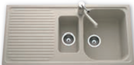
Evier 1 cuve 1/2 granit Dimensions : 100 x 50 cm 259 €