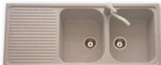
Evier 2 cuves granit. Dimensions : 116 x 50 cm 269 €