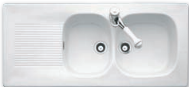
Evier grès réversible à encastrer 2 cuves : 112 x 51 cm, en blanc Réf. A02516102 176 €