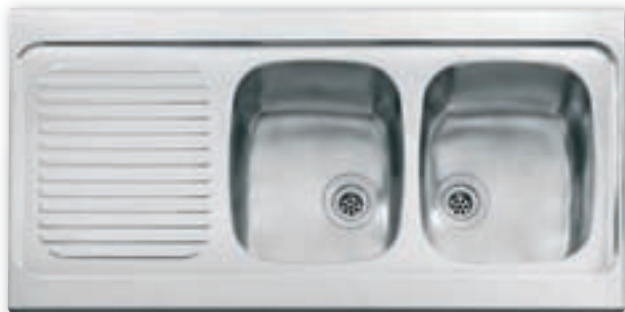
Evier à poser Inox 18/10 cuves soudées

1 cuve 1000 x 600 mm - Bassin 340 x 400 x 155 mm Réf. A00837967 96 €