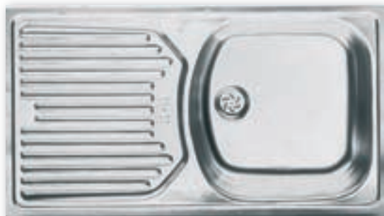
Evier à encastrer Eurostar Nouveau modèle d'encastrable en inox satiné idéal pour un premier équipement. Facile à poser et fonctionnel. Bon rapport qualité/prix

1 cuve 1 égouttoir 780 x 435 x 145 mm Réf. A00837153 110 €