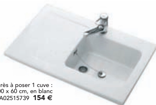
Evier grès à poser 1 cuve : 100 x 60 cm, en blanc Réf. A02515739 154 €