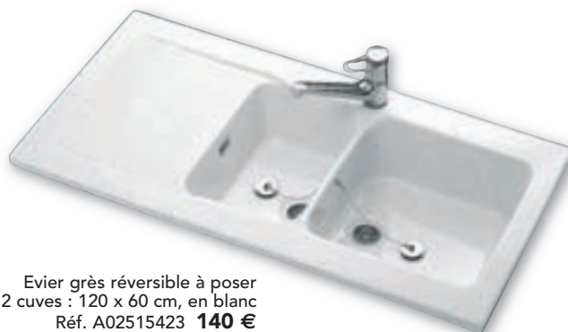
Evier grès réversible à poser 2 cuves : 120 x 60 cm, en blanc Réf. A02515423 140 €