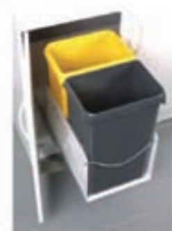
Possible d'adapter la poubelle tri sélectif 2 x 23 litres