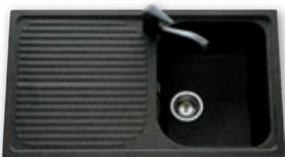
Evier 1 cuve granit Dimensions : 86 x 50 cm 249 €

Finition Granit : ● Terra - ● Lava - ● Alpina ● Arena - ● Sable - ● Pietra - ● Pera